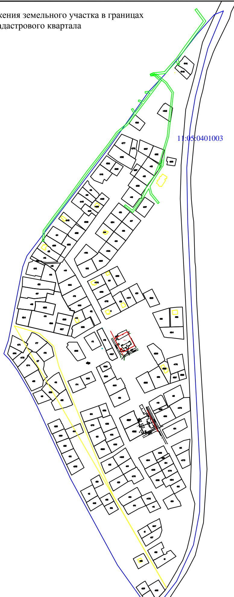
Схема расположения земельного участка в границах кадастрового квартала