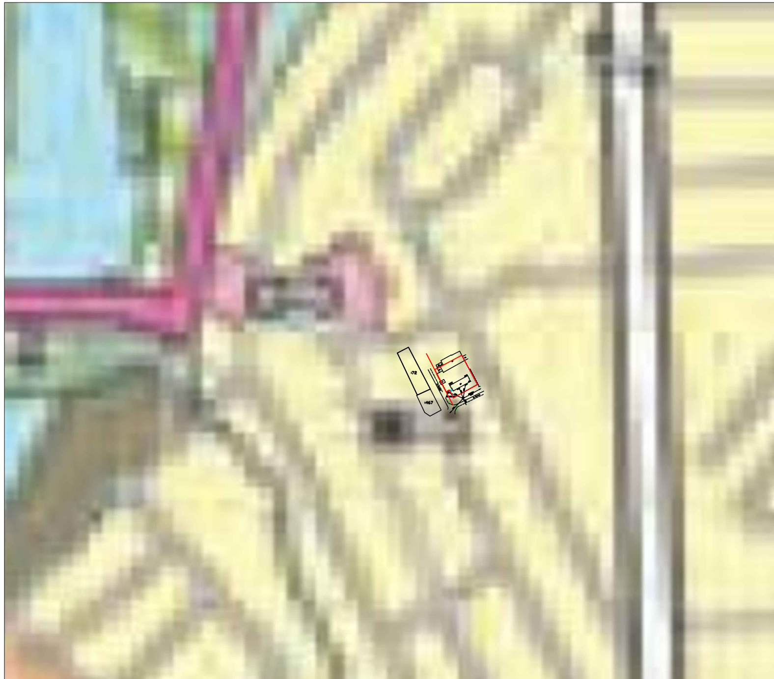
Схема расположения земельного участка в границах элемента планировочной структуры (квартал)